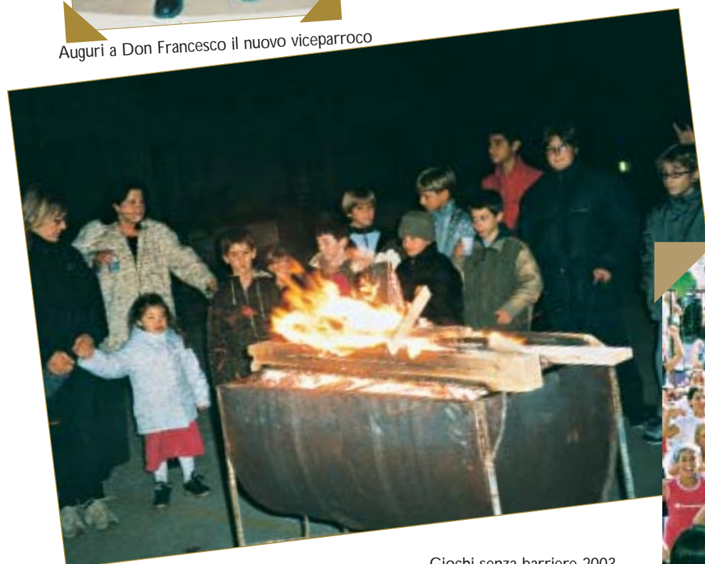
San Martino 2003