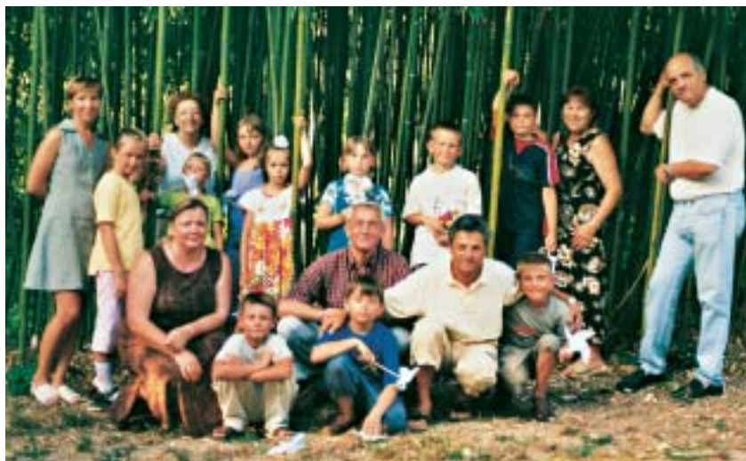
Bambini bieloruschi giugno 2003

Le eventuali offerte erogate a favore della Parrocchia da parte di Ditte