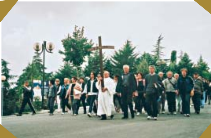
Pellegrinaggio Madonna della Rosa

La Chiesa vuole contare su chi sa vivere il Vangelo con le parole semplici della vita quotidiana per imparare a parlare al cuore di ogni uomo. Ogni giorno è possibile evangelizzare negli spazi della vita, nella famiglia e nella scuola, nel lavoro e nel tempo delle relazioni gratuite. Risiede in questo il valore di una parrocchia che affida il suo essere missionaria alla maturità di fede dei suoi laici, e che proprio per que-