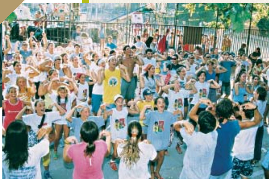
Giochi senza barriere 2003